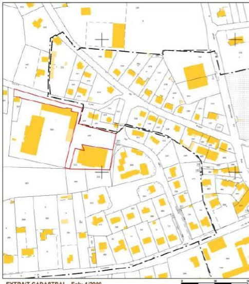
EXTRAIT CADASTRAL - Ech: 1/2000